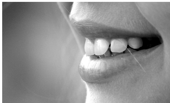
Für hellere ZÙhne: Bleaching